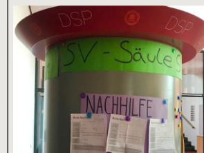
Unsere eigene Litfaßsäule für Informationen und Aushänge

Unsere Priorität ist es, die vierten Klassen in die SV-Treffen einzugliedern, damit auch die Grundschule einen Einblick bekommt. Außerdem stehen Sportturniere, und weitere Schuldiscos und Filmabende an. Außerdem werden wir dieses Jahr die neue Schülersatzung mit der überarbeiteten Wahlordnung präsentieren