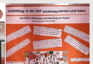
Plakat zum Leitbild der Schule