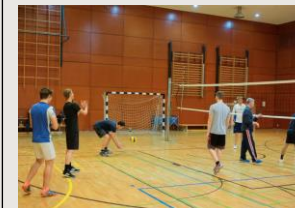
Das Volleyballturnier zwischen Lehrer- und Schülerteams

Unterstufendiscos, bei denen man mal nicht ü18 sein muss und Filmabende mit Freunden, Sportevents wie eine Fußballiga, das Volleyballturnier und weitere Sportturniere,