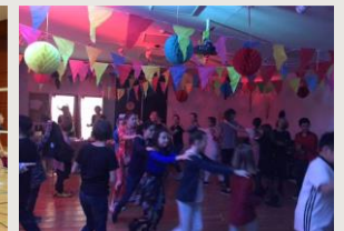
Unterstufen- und Faschingsdisco