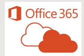
Office 365 - Plattform für Materialien und Lehrer-Schüler Kommunikation